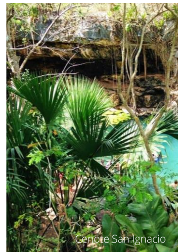
Cenote San Ignacio